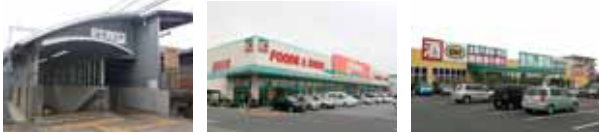
新ノ口駅徒歩8分 スーパーオークワ徒歩15分 業務スーパー徒歩13分