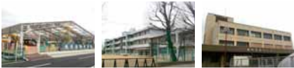
くちなし幼稚園・保育園徒歩3分 耳成小学校徒歩13分 運転免許センター徒歩2分